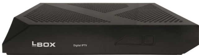
LBOX IP CLIENT